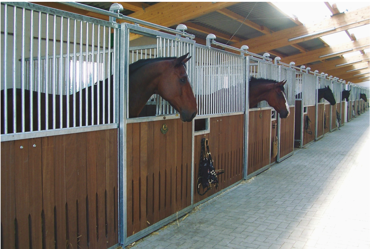
Abbildung 1: Beispiel einer Stallhaltung von Pferden in Boxen.

Unter dem Begriff der Haltung ist das Leben von Tieren in der Obhut des Menschen zu verstehen. Die Haltung von Pferden kann ihrer Form nach sehr unterschiedlich gestaltet sein. Eine Klassifizierung der Haltungsformen könnte beispielsweise danach vorgenommen werden, wie intensiv das Tier Umwelteinflüssen ausgesetzt ist, wie groß die Möglichkeit zu einem selbstbestimmten Ortswechsel ist und wie stark das Tier unter der Kontrolle des Halters steht. Beim Heranziehen dieser Kriterien lassen sich beispielsweise klar die Stall- und die Weidehaltung voneinander unterscheiden. Andere Haltungsformen, wie beispielsweise die Paddock-Boxen-, Laufstall- oder Offenstallhaltung, lassen sich als Mischformen hiervon auffassen und entsprechend gestaffelt einordnen.