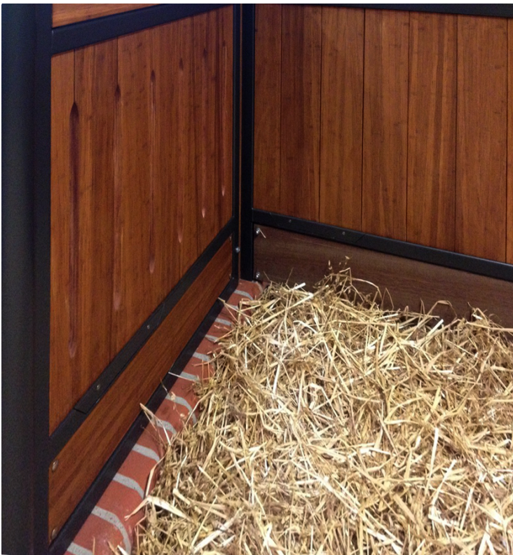
Abbildung 2: Detailaufnahme einer Boxenkonstruktion mit Mistbrett.

Insbesondere bei Boxenwänden wird unterhalb der Stallbohlen häufig ein waagerechtes Anschlussbrett, das sogenannte Mistbrett, eingebaut (Abbildung 2).