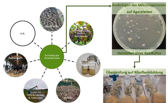
Abbildung 1: Übersicht zur Probennahme und Isolierung neuer Hefestämme